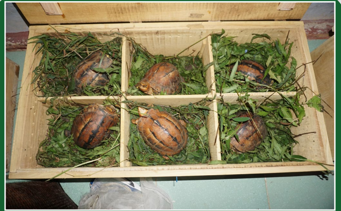
Những cá thể rùa được vận chuyển trong các hộp vận chuyển bằng gỗ trong chuyến đi dài từ Cúc Phương đến miền Trung Việt Nam.