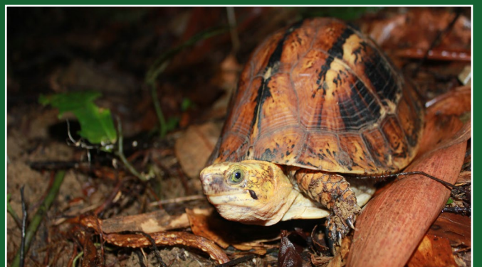
Một chú rùa hộp trán vàng miền Trung hạnh phúc trở lại với tự nhiên vào một ngày mưa.