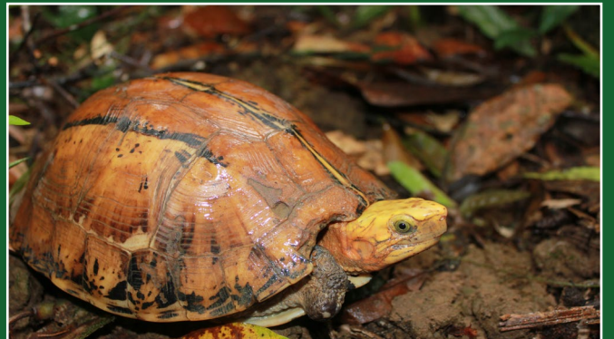
Một cá thể rùa hộp trán vàng miền Trung đã sống sót một cách bền bỉ khi bị chó săn cắn, sập bẫy và những nguy hiểm khác (bằng chứng là vết thương đã lành) trước khi được vận chuyển đến Trung tâm Bảo tồn Rùa vào năm ngoái. Ảnh: Hoàng Văn Hà -ATP/IMC.